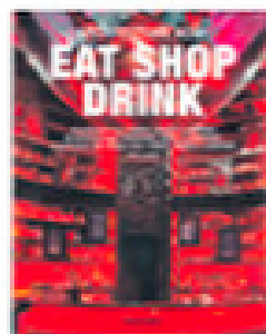
ARQUITECTURA «Eat Shop Drink» Philip Jodidio, Taschen. 426 páginas. 29 euros.

Se trata de un «proyecto viejo, del 2006, cuando la tecnología led estaba arrancando», explica Cotado. La idea era utilizar distinta iluminación para cubrir una franja de usos y horarios amplia, de la mañana a la noche, y que el local se fuese transformando a la vez que la paleta luminica. Para acentuar los efectos de color, los acabados son neutros y la mayoría de las superficies se pintaron en blanco. «Todo el mobiliario fue diseñado y proyectado ex-