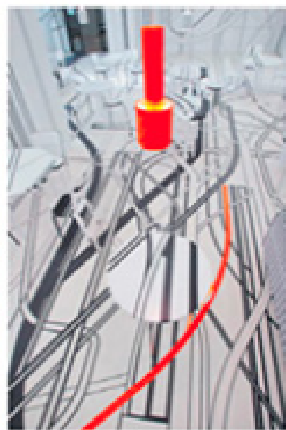
Café Logomo, en Turku (Finlandia), diseñado por Tobias Rehberger y Artek (www.artek.com)

es estándar: taburetes, mesas, la barra...», indica el diseñador. Cotado ( www.ivancotado.es ) toca en su trabajo todos los pulsos del contract y entre sus últimos proyectos destaca una tienda de ropa urbana en Millaoloiro (Ameis).