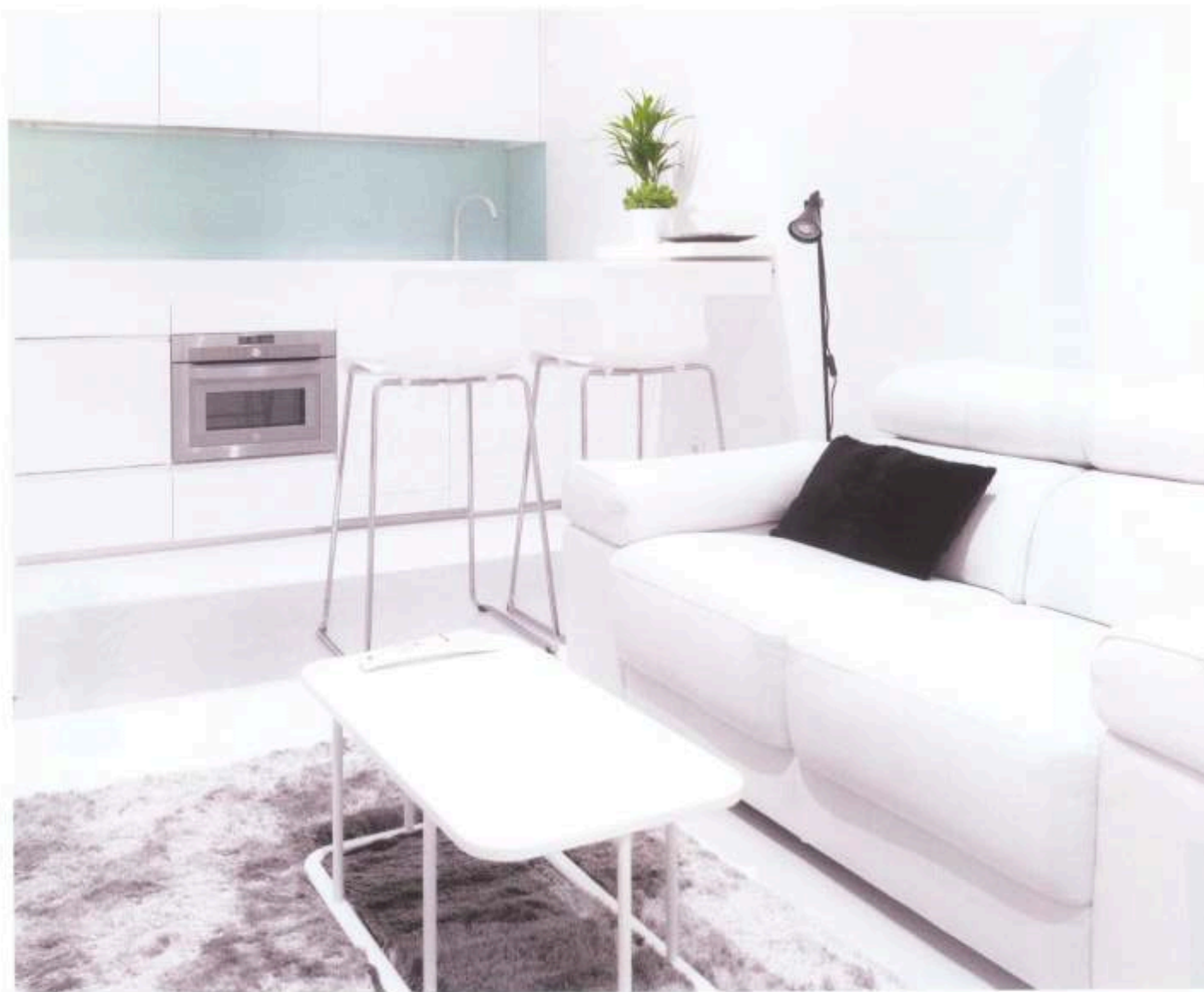
Texto: Ada Marqués.

La propietaria buscaba una vivienda totalmente personalizada y adaptada a sus gustos y forma de vida situada en pleno centro de Madrid, de ahí que la primera visita a un inmueble en el barrio de Malasaña no la asustase a pesar de su estado de abandono y deterioro. Era consciente que entre la amplia oferta de viviendas terminadas y estandarizadas jamás encontraría algo que la encajase al cien por cien, de ahí que en todo momento buscara apartamentos para reformar, no importándole el estado original de los mismos, sino las posibilidades de cara al futuro proyecto y su situación en la ciudad. En la primera visita de trabajo se comprueba la buena predisposición del espacio en cuestión a pesar de sus reducidas dimensiones, 28 m 2 , en total, para lo que ella deseaba.